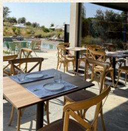
No coração da natureza